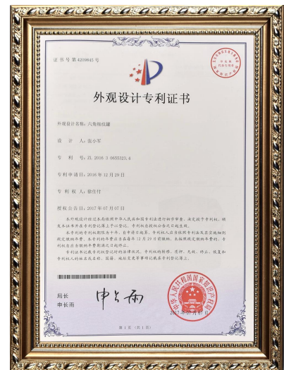
не патент № .: +201630655323,4