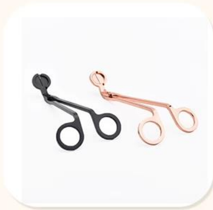
Wick Trimmer Cutter