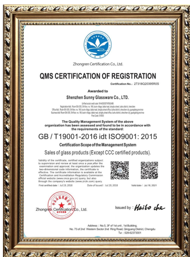
ISO 9001: 2015