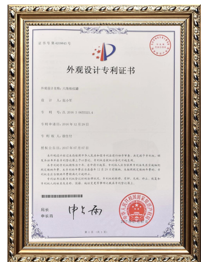
Патент №: 201630655323.4