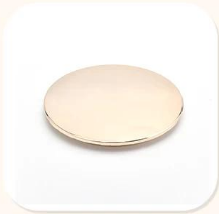
Zinc Alloy Cover