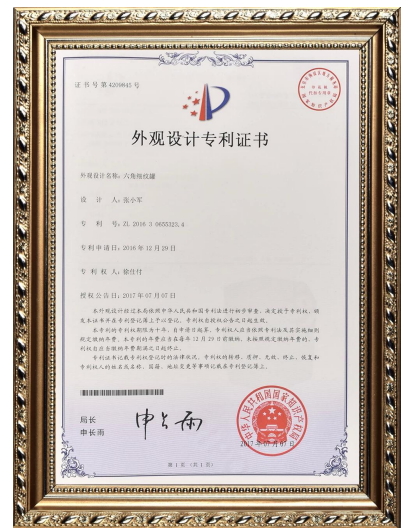
Патент №: 201630655323.4