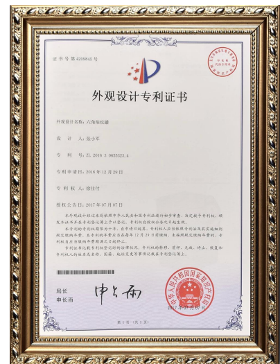
Патент №: 201630655323.4