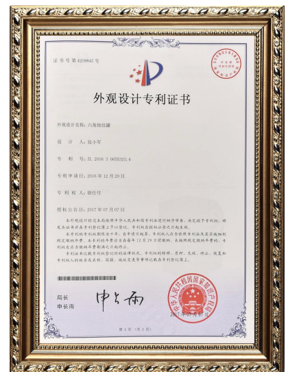
Патент №: 20163065532.4