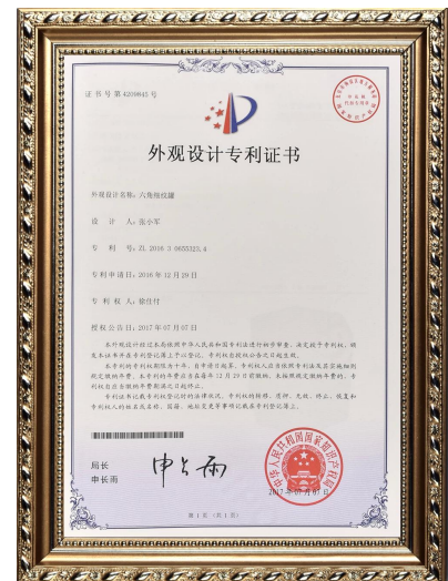
Номер патента: 201630655323.4.