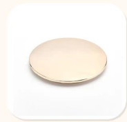
Zinc Alloy Cover