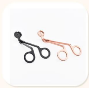
Wick Trimmer Cutter