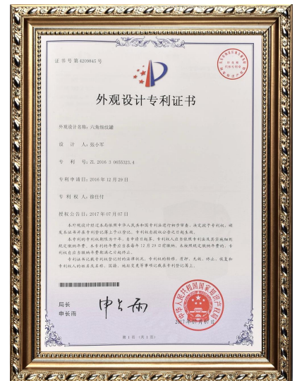
Патент №: 201630655323.4