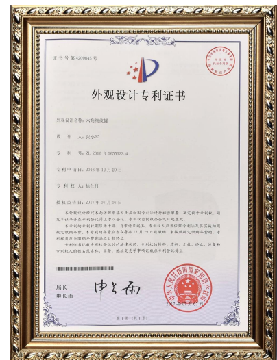
Номер патента: 201630655323.4.