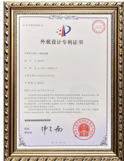
Патент №: 201630655323.4