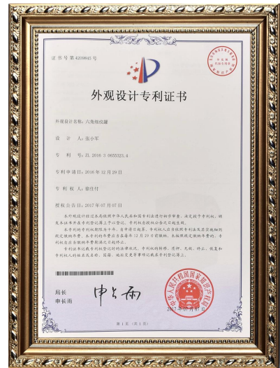
Номер патента: 201630655323.4.