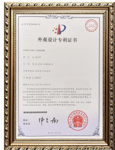
Номер патента: 201630655323.4.