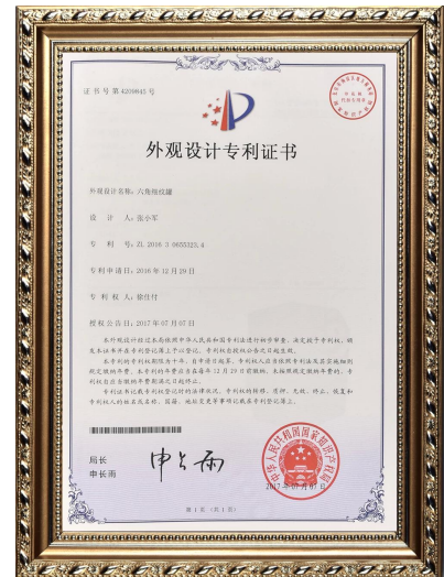
Номер патента: 201630655323.4.