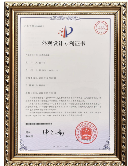
Патент №: 201630655323.4