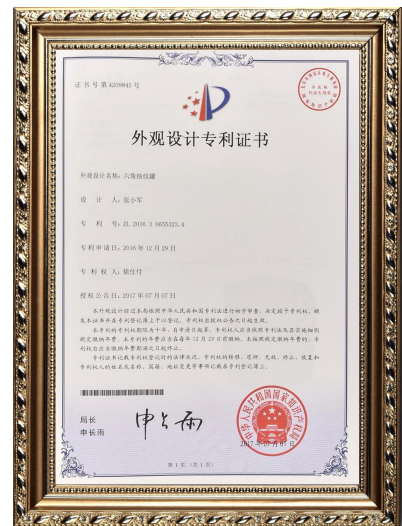
Патент №: 201630655323.4