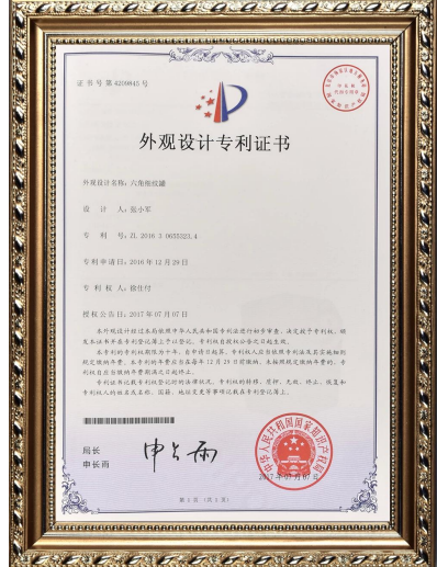
Патентный номер: 20163065523.4