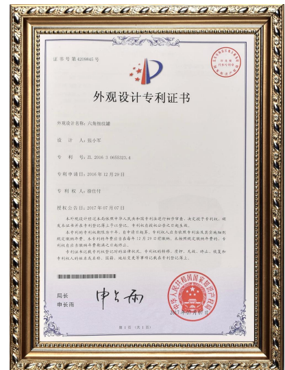
Патент №: 20163065532.4