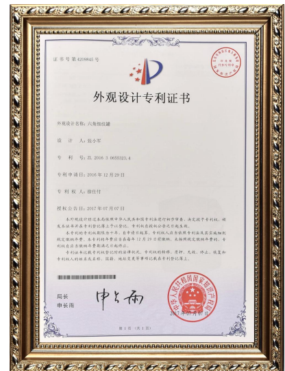
Патент №. 2.201630655323.4