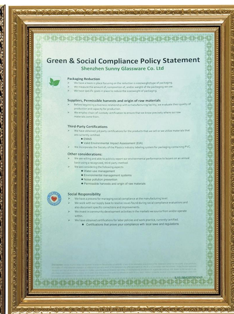
Экологичность и социальная ответственность Заваление Полици