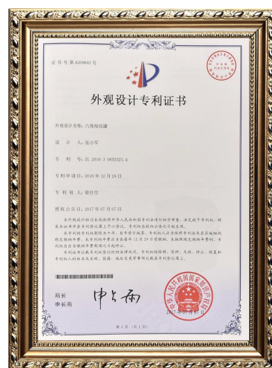
Номер патента: 201630655323.4.