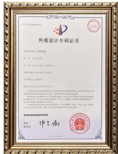
Номер патента: 201630655323.4.