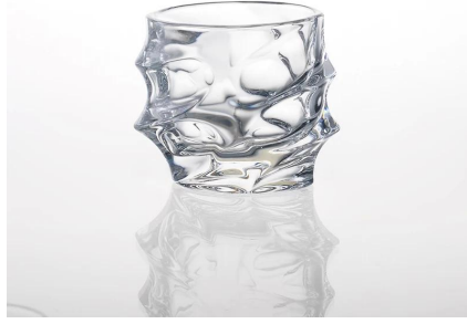
украшения из стекла свечи держатель