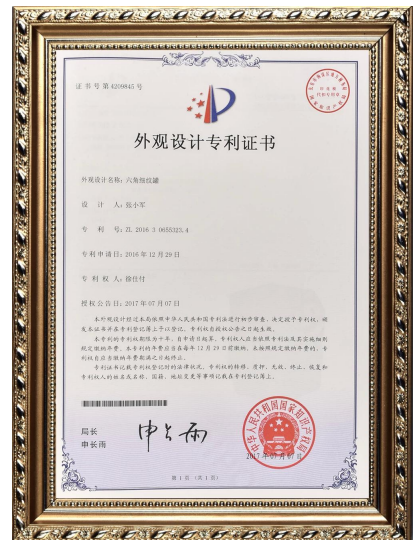
Патент №: 20163065523.4