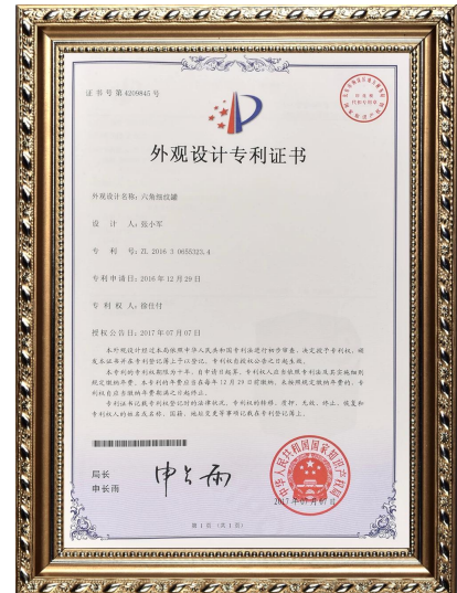
Патент №: 201630655323.4