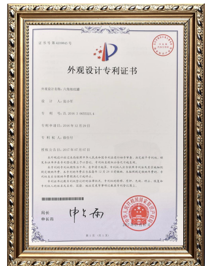
Номер патента: 201630655323.4.