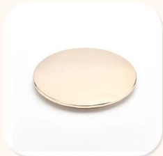
Zinc Alloy Cover