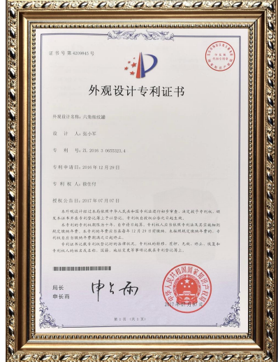
Патентный номер: 201630655323.4