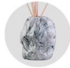
Water Transfer Printing