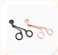
Wick Trimmer Cutter