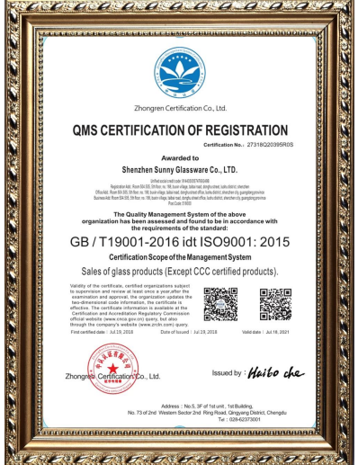
ISO 9001: 2015