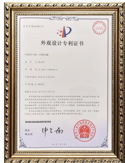
Патент №: 201630655323.4