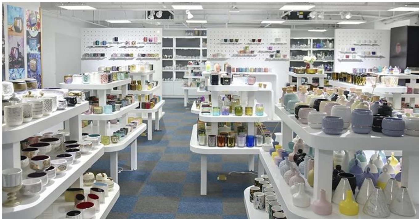
Стакан производство Линия