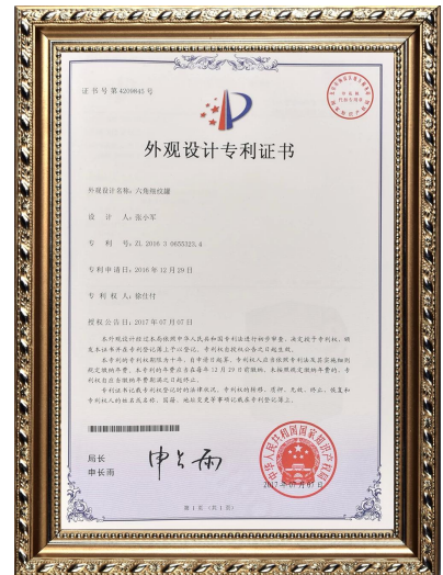
Патент №: 201630655323.4