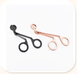
Wick Trimmer Cutter

. Декоративный ужин в баре или баре . Подходит для семей, отелей или садов. . Особый подарок любовнику . Любой шанс украшения