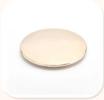
Zinc Alloy Cover