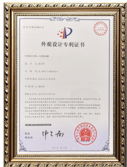
Патент №: 20163065532.4