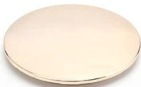
Zinc Alloy Cover