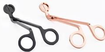
Wick Trimmer Cutter

Отказ Декоративный ужин в баре или в баре