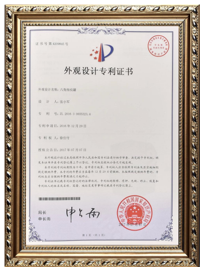
Патент n.: 201.630.655.323.4