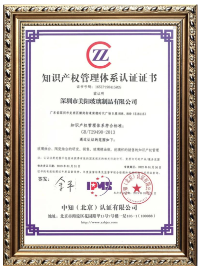
Бизнес интеллектуальная собственность