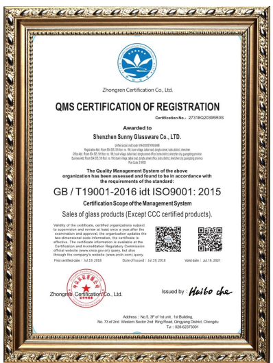
ISO 9001: 2015