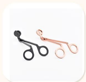
Wick Trimmer Cutter

ПолеМ Декоративный ужин в баре или баре ПолеМ Подходит для семей, отелей или садов ПолеМ Специальный подарок любовника ПолеМ Любый шанс на украшение