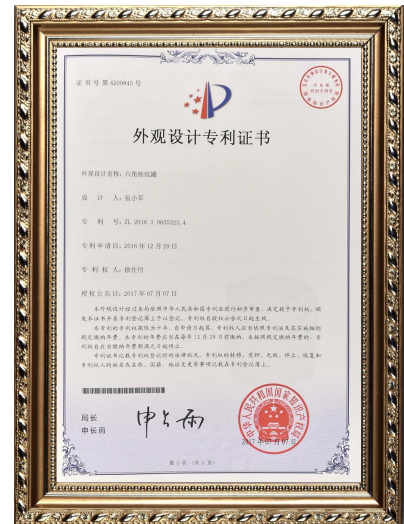
Патентный номер: 20163065523.4