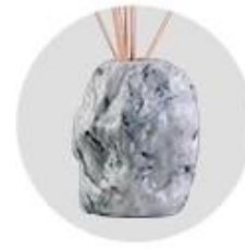
Water Transfer Printing