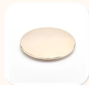
Zinc Alloy Cover