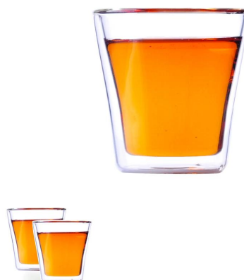
100 мл Borosilicated Двухместный стеклянный стакан,