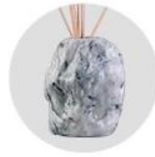
Water Transfer Printing