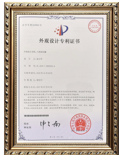
Патентный номер: 201630655323.4