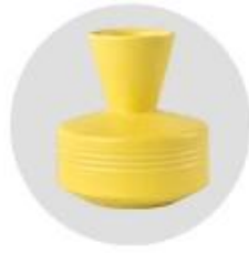
Solid color glaze