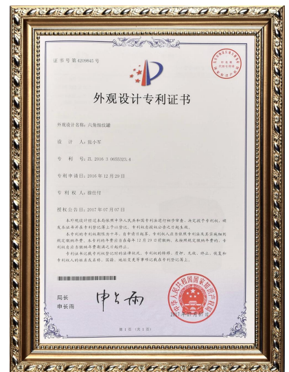
Патент №: 201630655323.4.