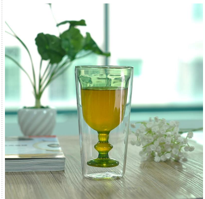
Двойная стенка из боросиликатного стекла питьевой