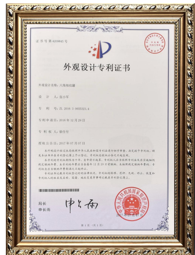
Номер патента: 201630655323.4.