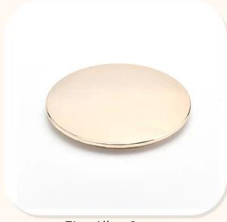
Zinc Alloy Cover