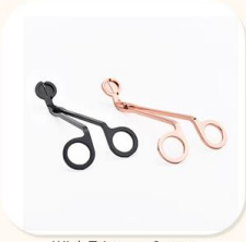
Wick Trimmer Cutter