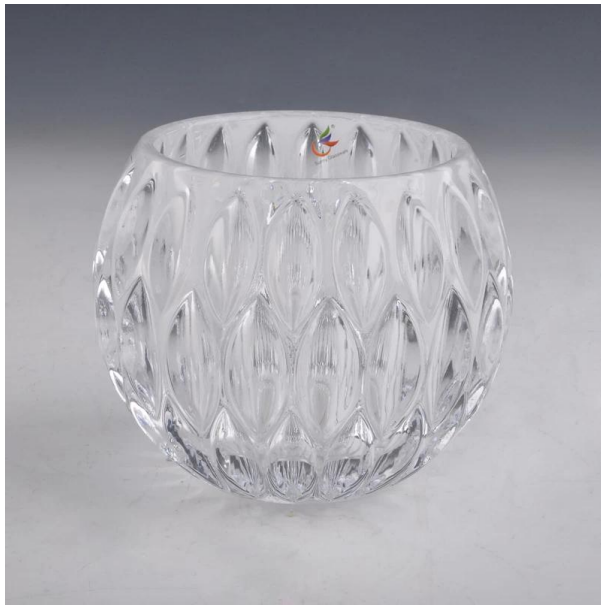
круглый стеклянный подсвечник