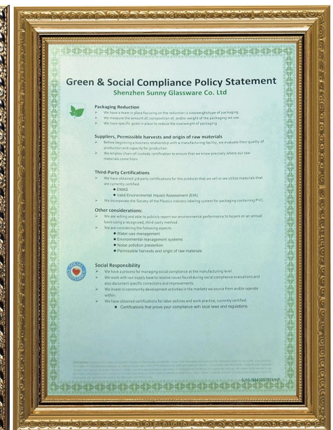
Экологичность и социальная ответственность Заваление Полиди