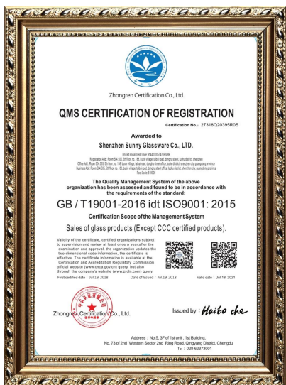
ISO 9001: 2015