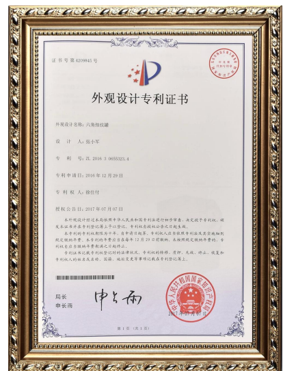
Патент №: 201630655323.4