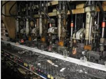
□ IS Machine