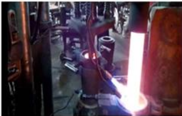
□ Machine Pressed