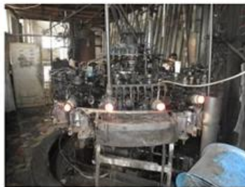
□ Machine Blown