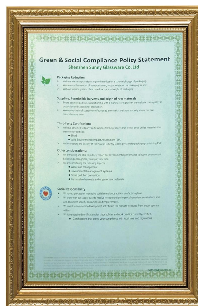
Зеленый и социальный контроль Заявление Полиди