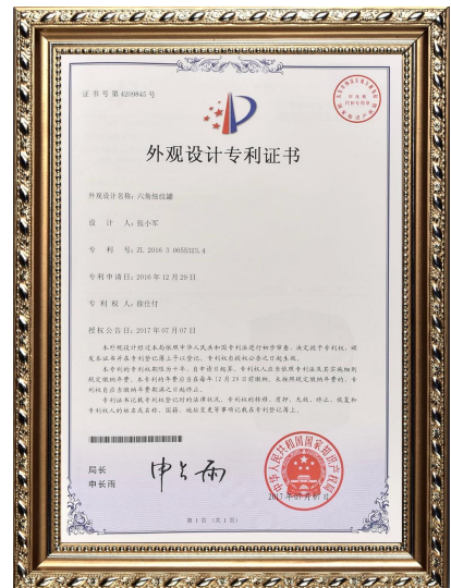
Патент №: 201630655323.4