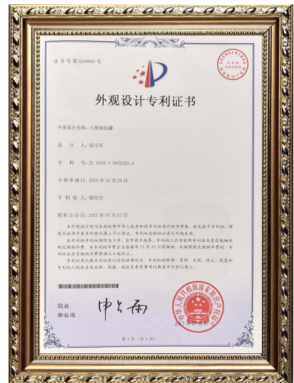
Патент №: 20163065532.4