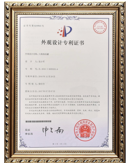
Патент №: 201630655323.4