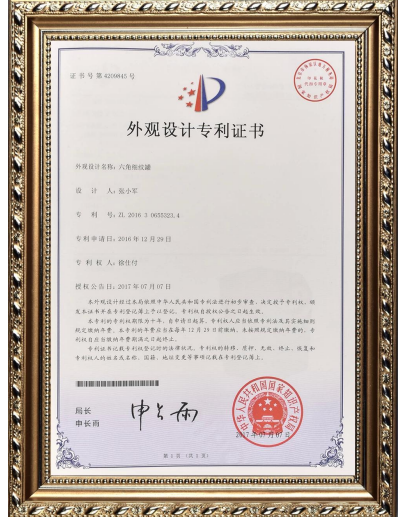
Патентный номер: 20163065532.4