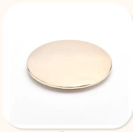
Zinc Alloy Cover