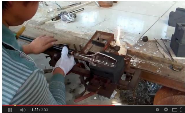
Техника ручного выдувания