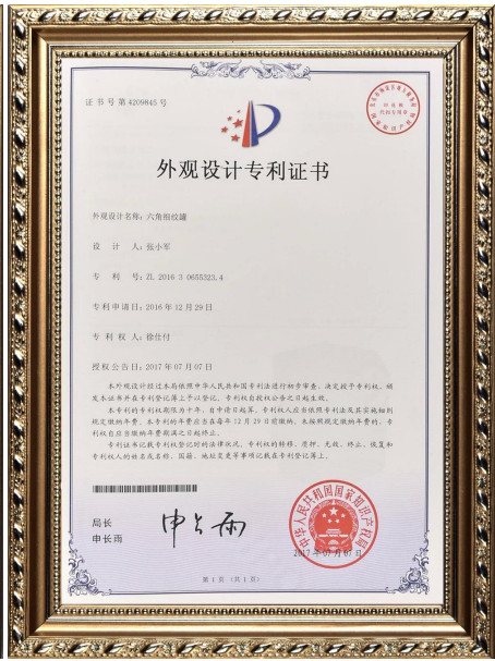
Патентный номер: 201630655323.4