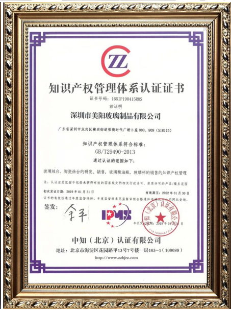
Интеллектуальная собственность предприятия