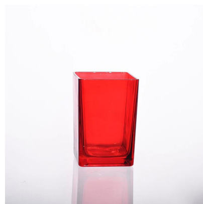
спрей цвет держатель стекла свечи